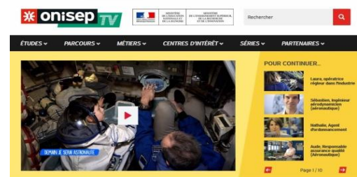
Plate-forme vidéo de l'Onisep. 1500 films sur les métiers et les formations. Des reportages, des témoignages de professionnels et d'élèves au travail et en cours d'études. Des entrées par métiers, études ou itinéraires. Recherche par mots-clés. Vidéos accessibles sur ordinateurs, tablettes et mobiles.